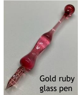
Gold ruby glass pen