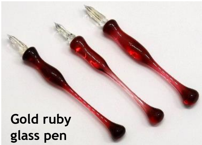
Gold ruby glass pen